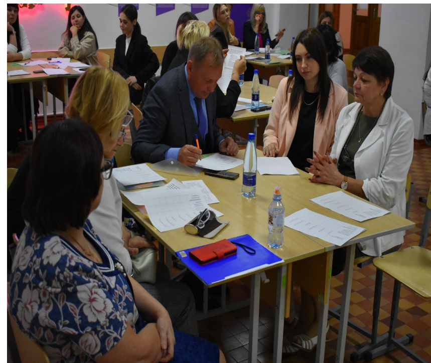
Педагоги участвуют в семинарах, вебинарах, стажировках, мастер-классах